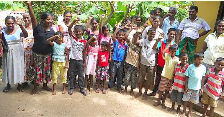
Parrainage Egodamulla Juillet 2011

Le parrainage est une action très importante dans la vie d'une association. Cela permet d'aider un enfant dans sa scolarité, les parents dans leur vie de tous les jours et cela permet de créer des liens entre un enfant et une famille même si ils sont à des milliers de KM de distance ; échange de photos, de correspondances ,de petits cadeaux etc.. sans parler des visites que certaines familles françaises rendent à leur filleul(e) du bout du monde.