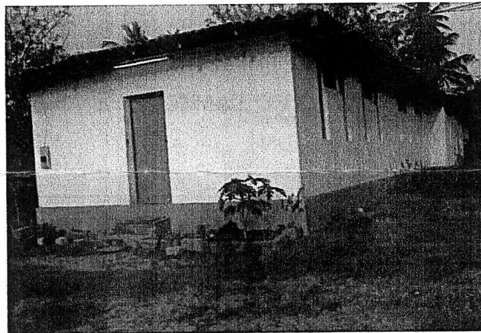
La maison de l'espoir

Notre correspondante Indranie MENDIS avec l'aide du vice-président du conseil de région Chana MENDIS, a trouvé une maison à Ballapitilya que nous utiliserons pour accueillir les enfants la journée .Cela permettra d'occuper ses enfants et de soulager les parents .Pour éviter des frais trop importants un tour de garde des parents pourrait être envisagé. Une jeune fille handicapée a été pressentie pour la gestion administrative.