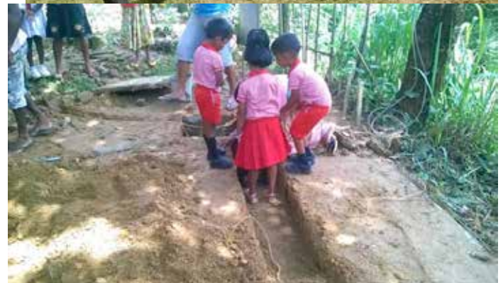
Pose de la 1 ère pierre