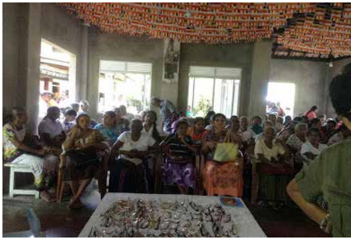
Distribution de lunettes (Mandadeniya)