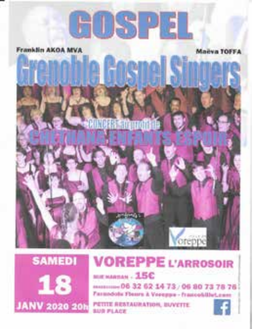
L'affiche du concert