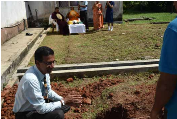
Pose de la 1 ère pierre par le directeur de l'hôpital