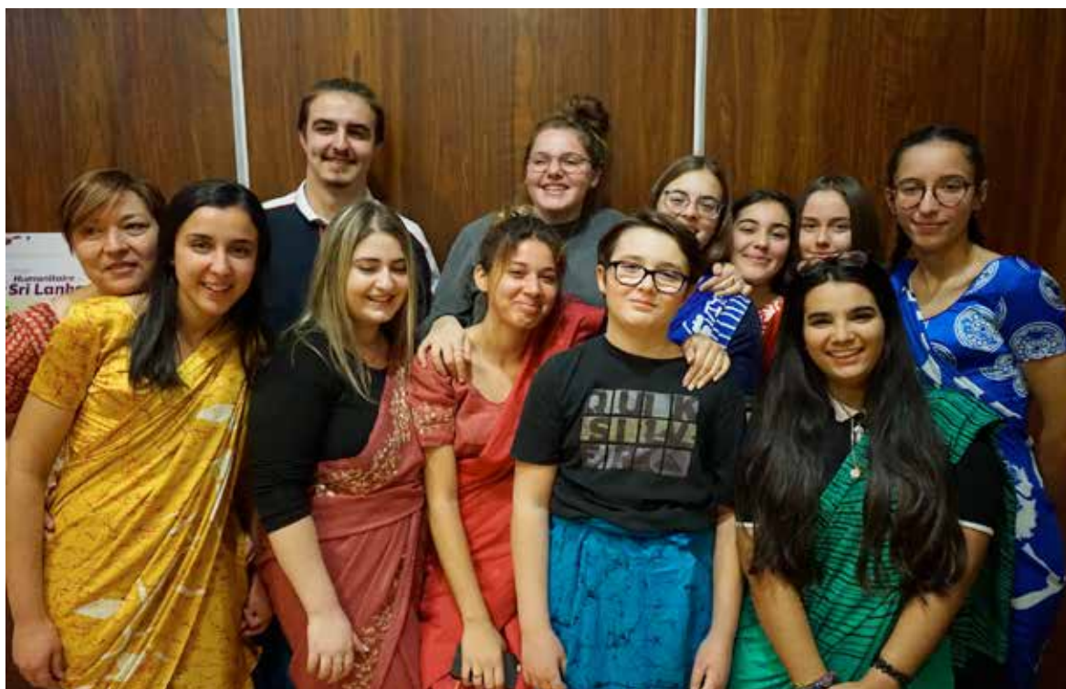
Les voilà !