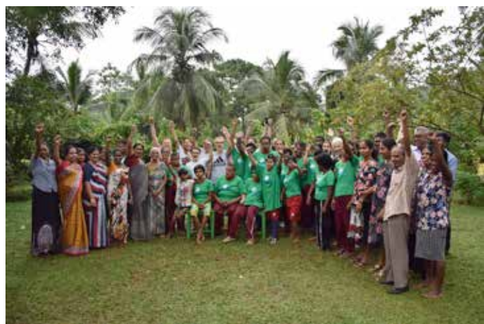
Rencontre enfants Gonopola