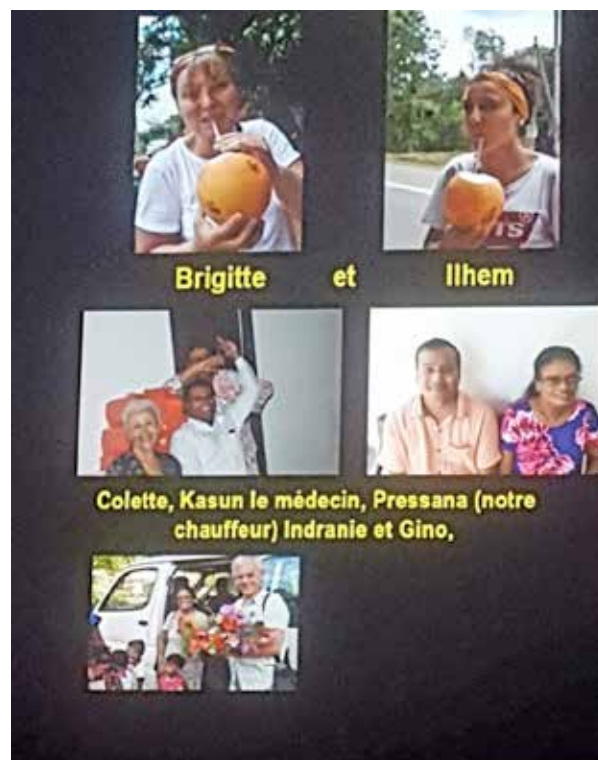
Les encadrants au Sri Lanka