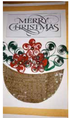
Cartes de vœux des enfants

sieur Claude (voir ci-dessus). Il pourra se déplacer plus facilement car il possède un véhicule, il peut faire des photos, nous espérons pouvoir avoir plus d'informations, notamment pour les enfants parrainés qui restent un peu dans l'ombre car étant un peu isolés géographiquement. Indranie restant bien entendu « le support principal ».