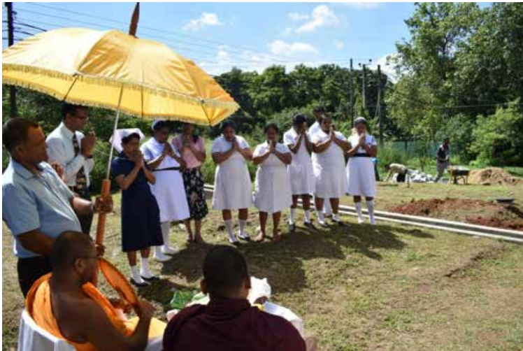
Début du travail avec des bénédictions et le choix d'un moment propice