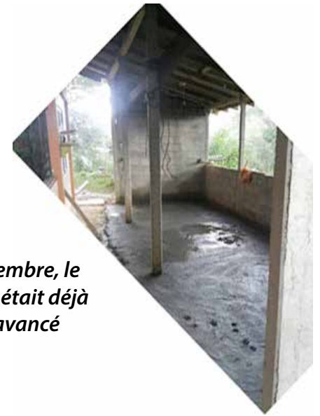
Fin novembre, le chantier était déjà bien avancé

Et voici les dernières nouvelles de décembre : l'école est finie !