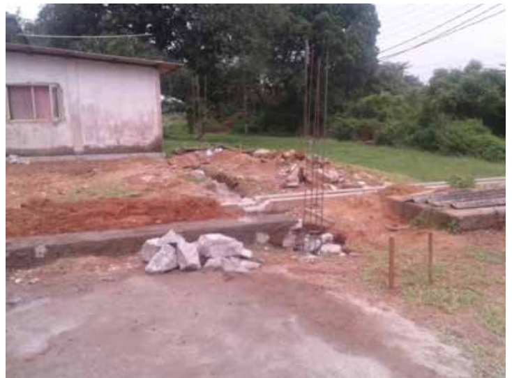
Construction en cours... (Photos prises le 05.11.2019) - fondation et colonnes en béton.

L'unité clinique assurera la logistique et le service de chirurgie, l'unité médicale, le laboratoire et la salle d'opération fourniront les soins appropriés, le cas échéant. Comme indiqué dans la proposition de projet, cette unité s'occupera des plaies chroniques pour traiter trois à quatre personnes en même temps et sera également fonctionnelle tous les jours de la semaine et le samedi.