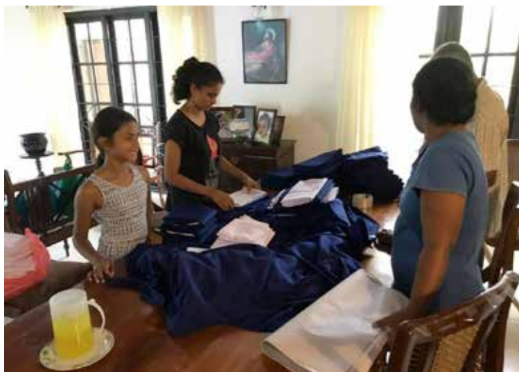
Tout le monde répare le matériel