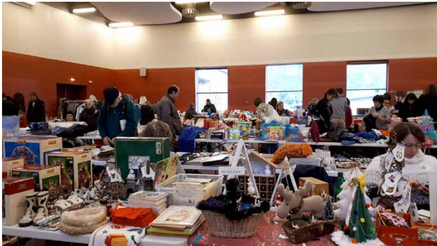
Noël peut se préparer