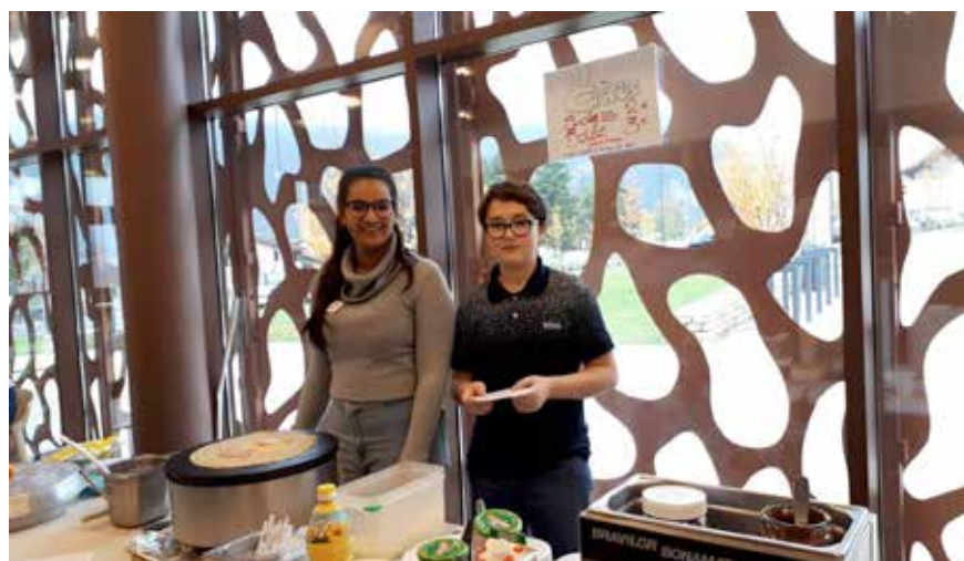
Encore les jeunes du PIJ - Merci