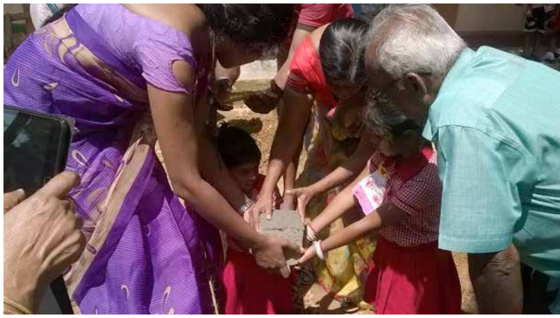
Pose de la 1 ère pierre