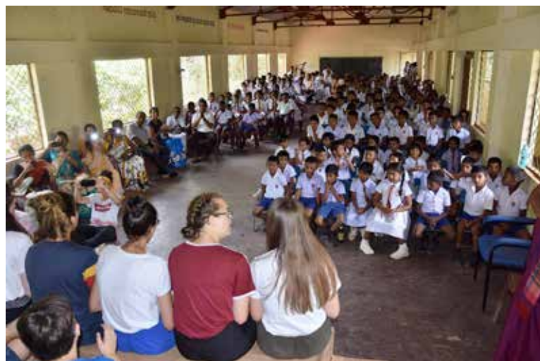
Ecole Suriyawewa vers Galle