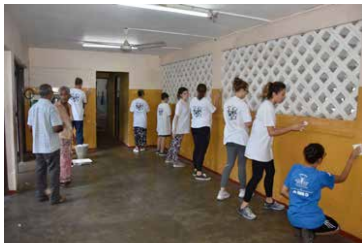
Chantier Sumaga mount Lavinia

Une première découverte du Sri Lanka en visitant Co-