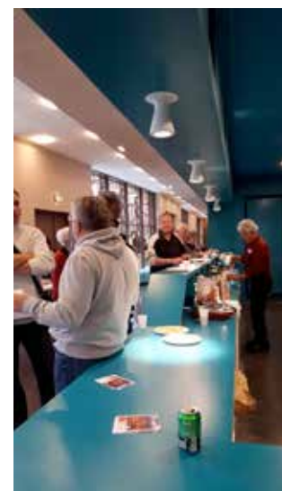
Un petit moment de répis