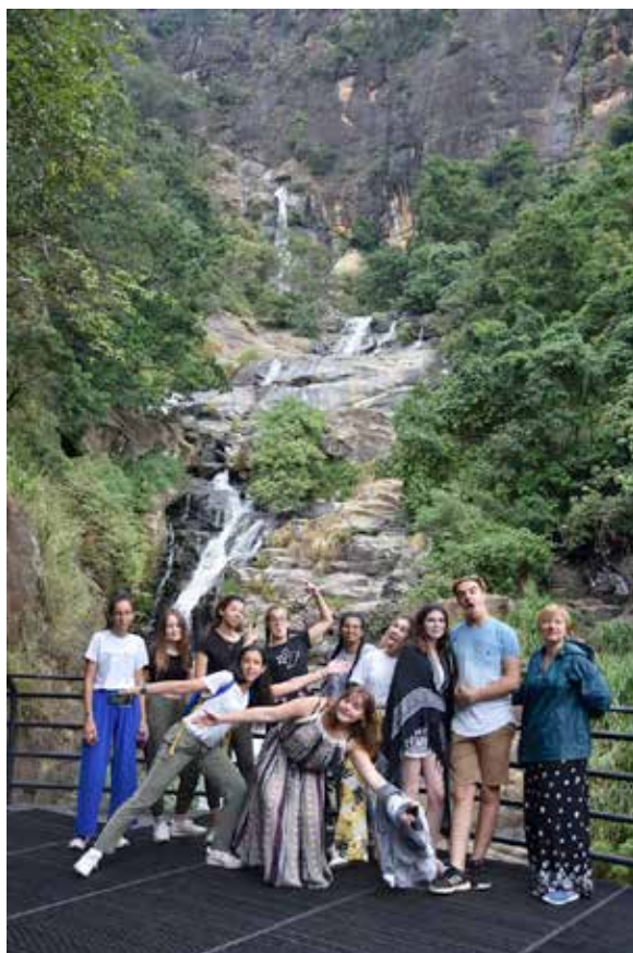
Sur la route ...