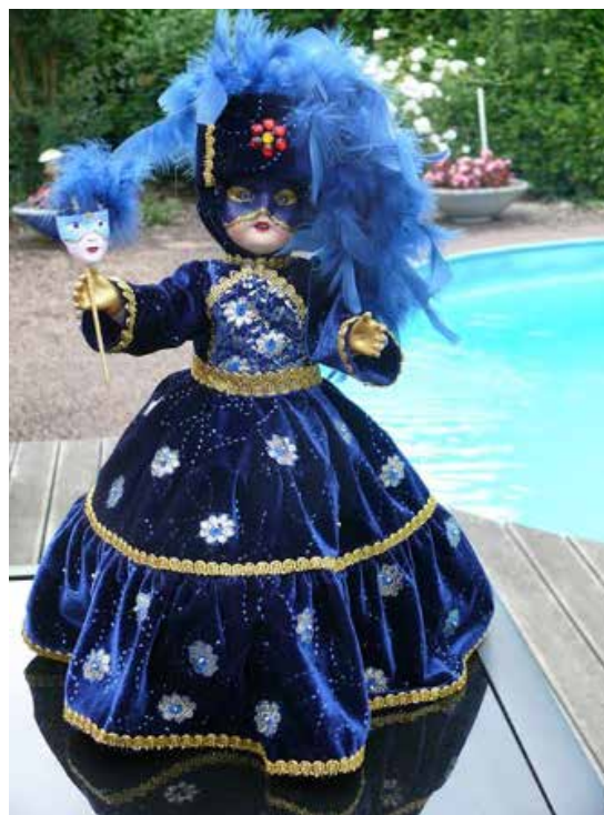
Une des poupées vendue