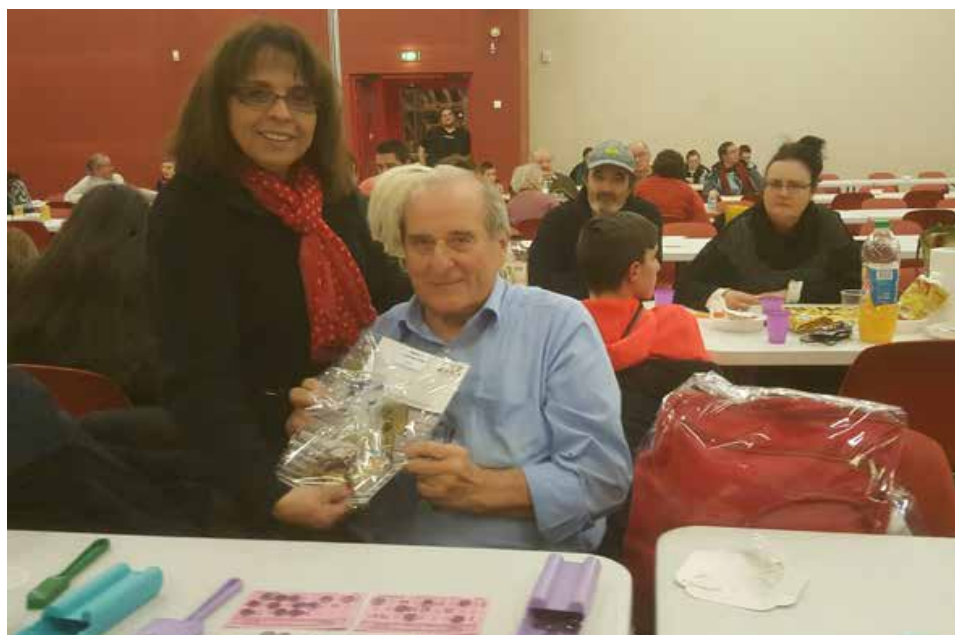
Le gagnant du 1er prix