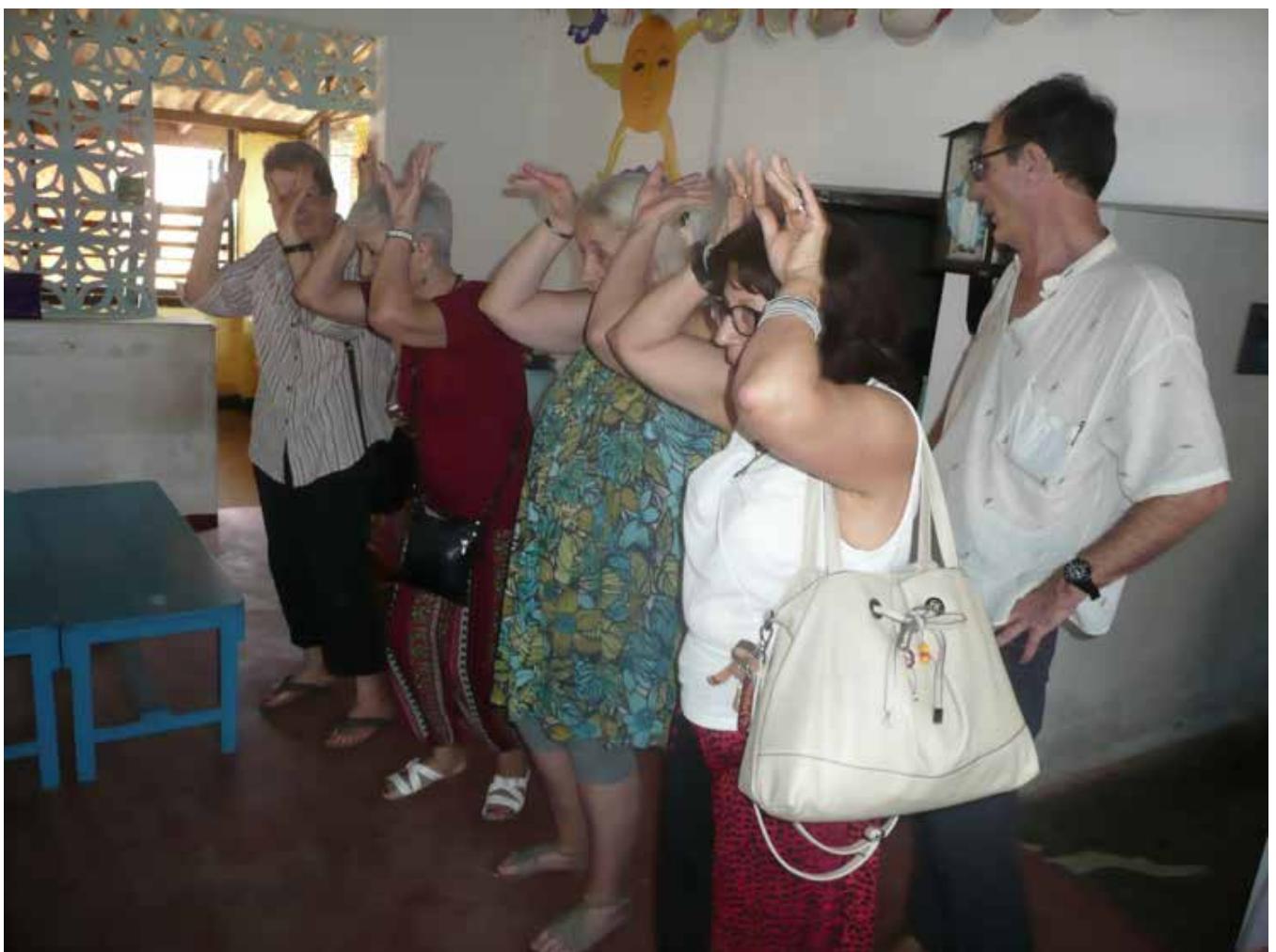
Sans commentaire..., un lapin avait tué un chasseur en Shri Lankais