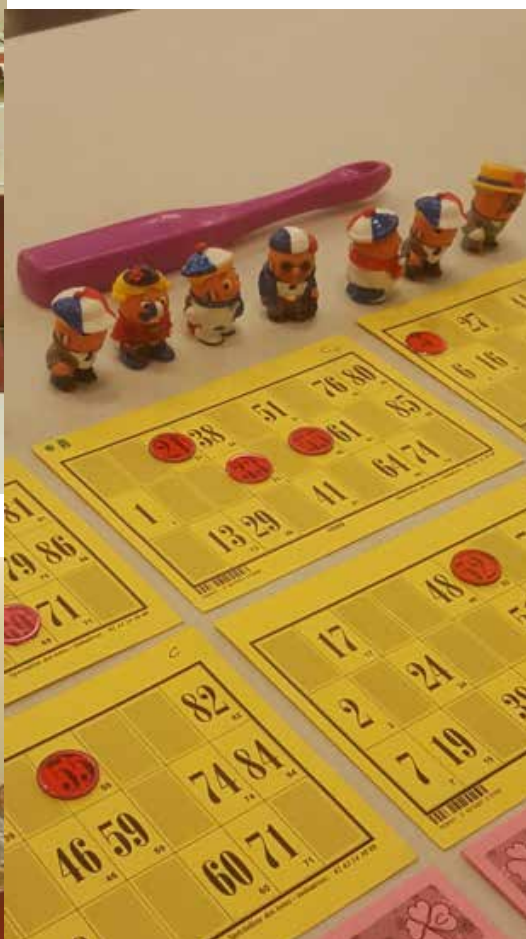
Les porte-bonheurs sont en place, les numéros sortent