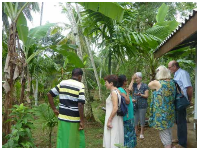
Le jardinier est fier de faire visiter son jardin