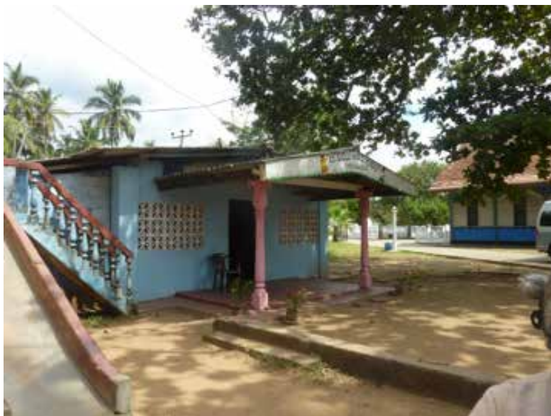
La maternelle reconstruite