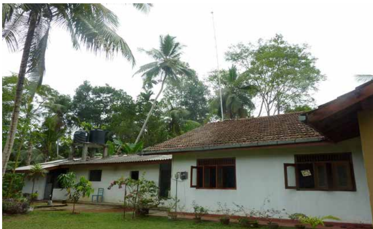
La maison du gardien en prolongement de la maison