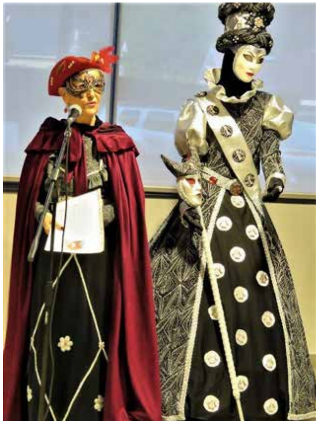
Lors du vernissage de l'exposition avec à droite le costume de Colette de cette année

Le vernissage a eu lieu vendredi 10 mars. Une foule nombreuse a pu admirer des costumes scintillants et rêver le temps de la visite.