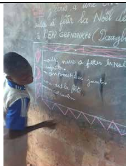
Un élève raconte Noël au tableau