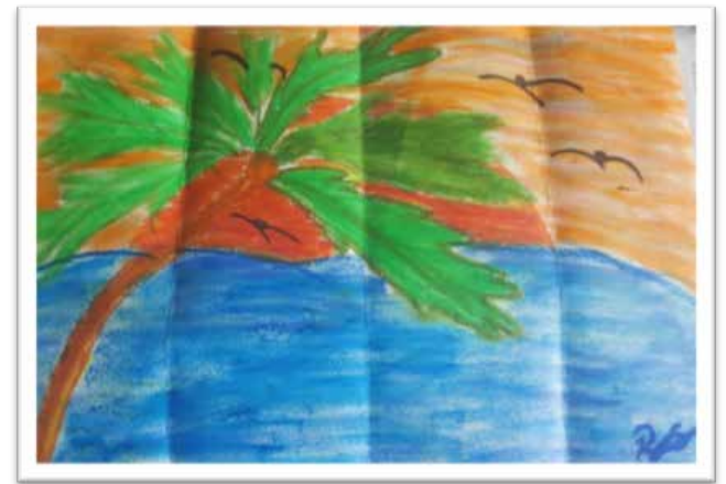
Dessin offert par un enfant