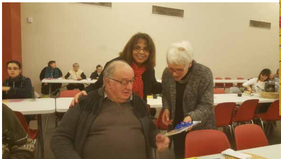
L'heureux gagnant du second prix