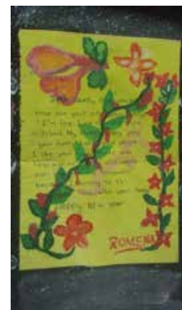
Autre dessin offert