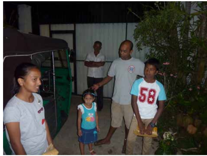
Lors d'une visite chez des filleuls