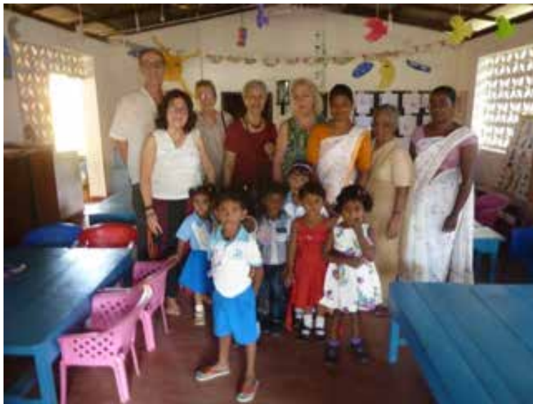
Les enfants, les instituteurs et la délégation