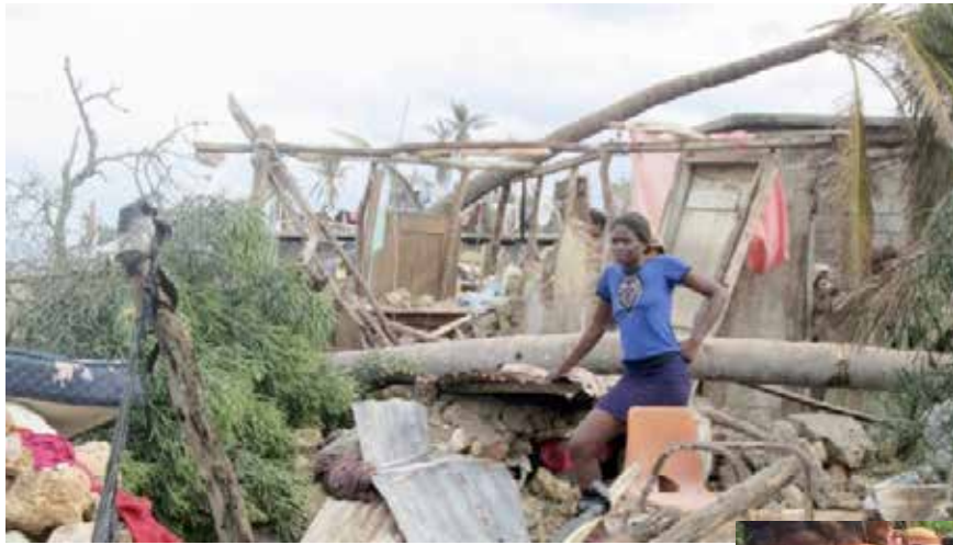
L'arbre est tombé sur la maison