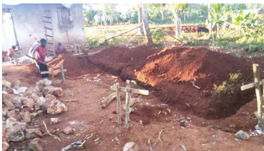
La reconstruction a commencé