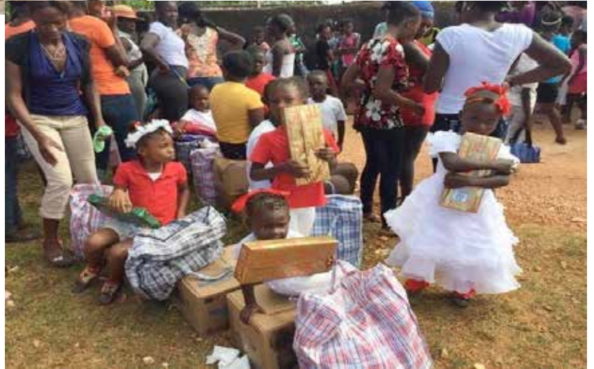
Les enfants reçoivent des dons