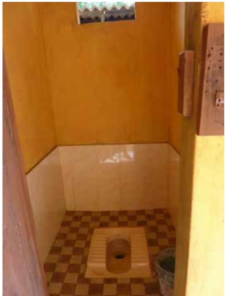
Les WC rénovés