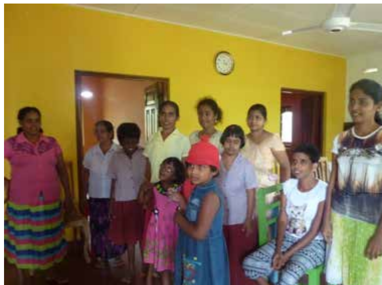
Sept des enfants de la maison avec les instits et des parents