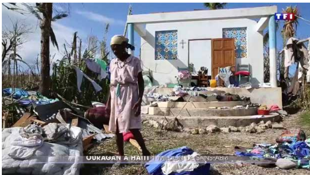
Ce qu'il reste après le passage de l'ouragan