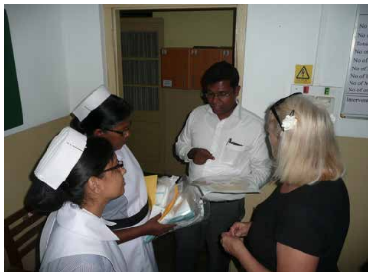
Remise de matériel aux infirmières