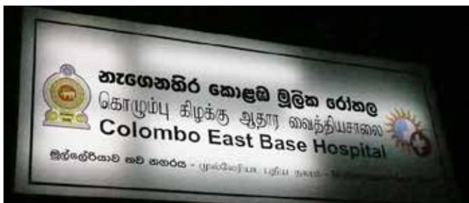
L'entrée de l'hôpital de Colombo où exerce Kasun