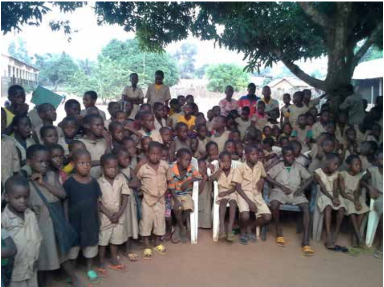
Les enfants réunis pour la fête