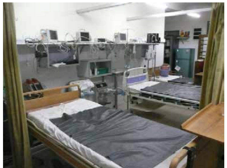
Les séparations de lits et les matelas offerts