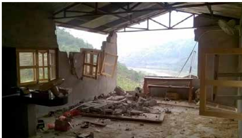
Après le tremblement de terre, les maisons détruites

http://tibetainsetpeuplesdelhimalaya.unblog.fr/