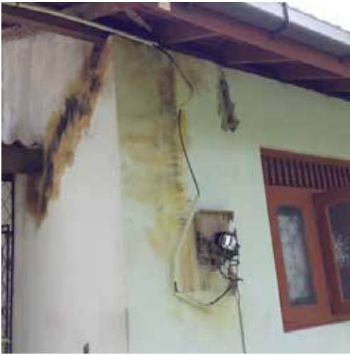
La foudre a frappé la maison !!