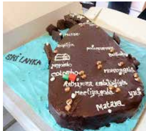
La reconstitution du Sri Lanka par le pâtissier de Voreppe