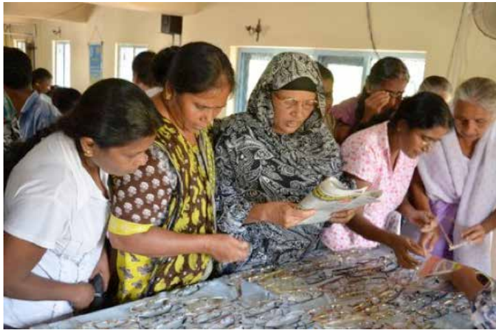
Choix de la bonne paire