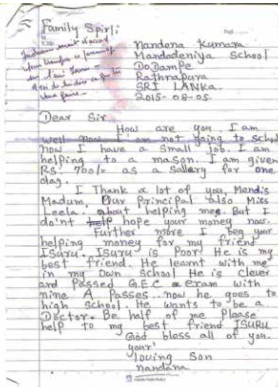
Lettre du filleul