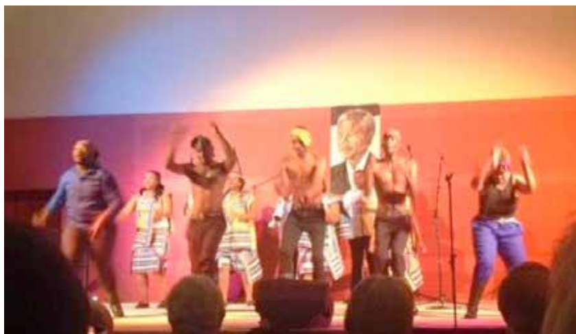
«Memeza in me» en représentation à l'Arrosoir