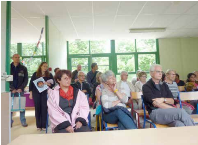
Une assemblée attentive

Présentation de l'Association « Amis de Children's Home » et « Tibétains et Peuples de l'Himalaya », associations que Chethana a choisi d'aider suite au séisme du 25 avril 2015 au NEPAL, elles travaillent comme nous en direct avec des représentants locaux. Les sommes collectées seront partagées entre elles deux, sommes auxquelles CHETHANA se joindra pour un montant à décider lors du bilan financier.