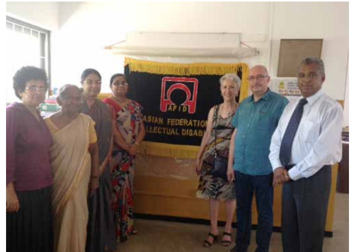
Officialisation du partenariat avec Sumaga