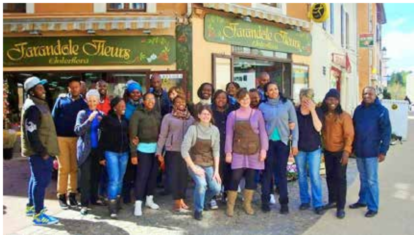
Le groupe a donné une représentation devant Farandole Fleurs à Voreppe