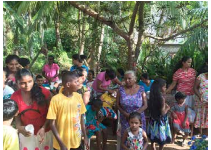
A Balapitiya, une belle rencontre