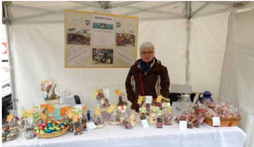
Sur le marché de Voreppe