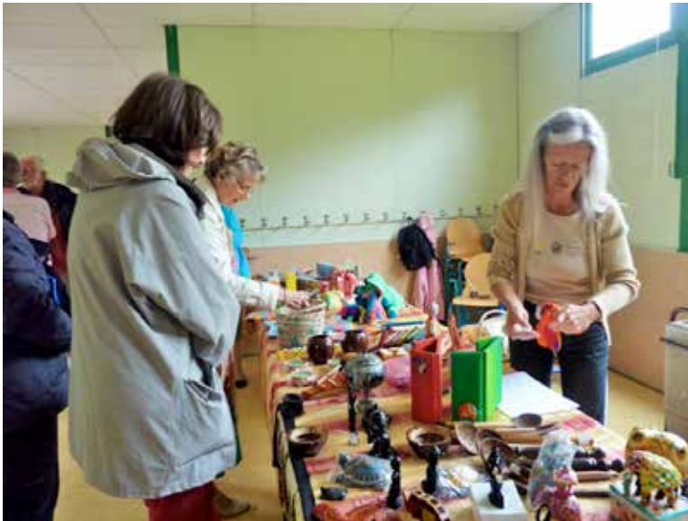
Le stand d'artisanat

Joie de retrouver les anciens adhérents et les habitués, mais joie aussi de faire connaissance des nouveaux.