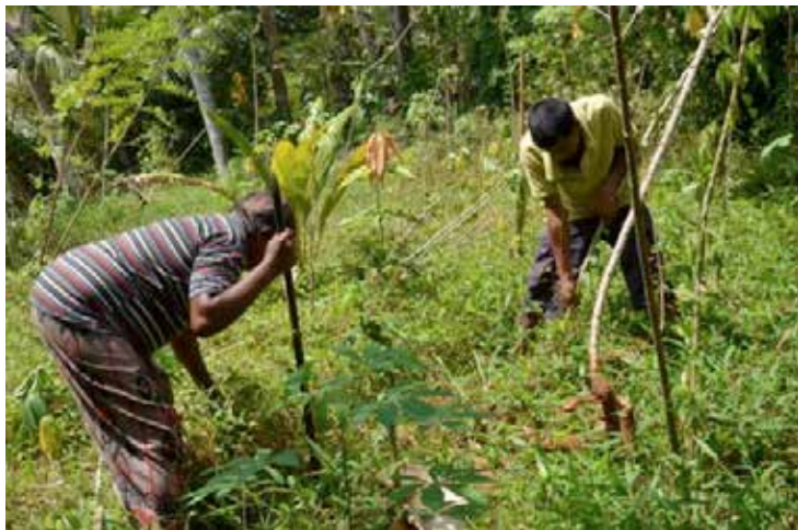
Nos jardiniers en pleine action