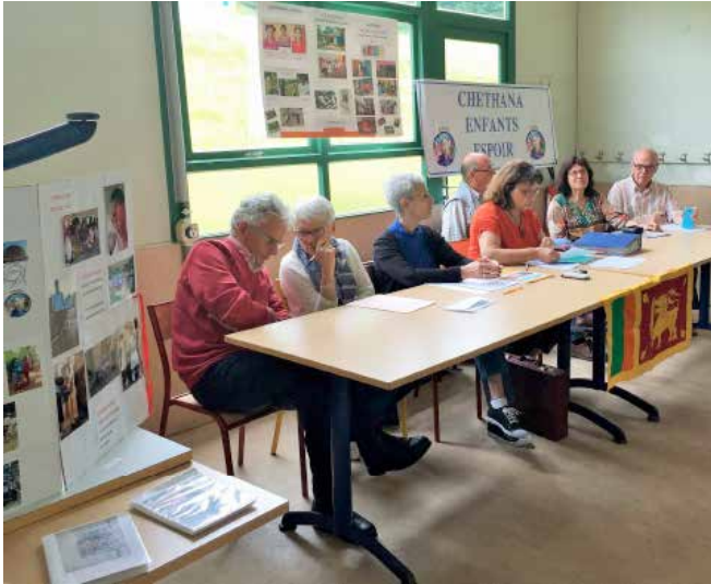
Le CA sortant

Nombre d'adhérents présents : 28 Nombre d'adhérents représentés : 6 Membres du Conseil d'Administration : 6