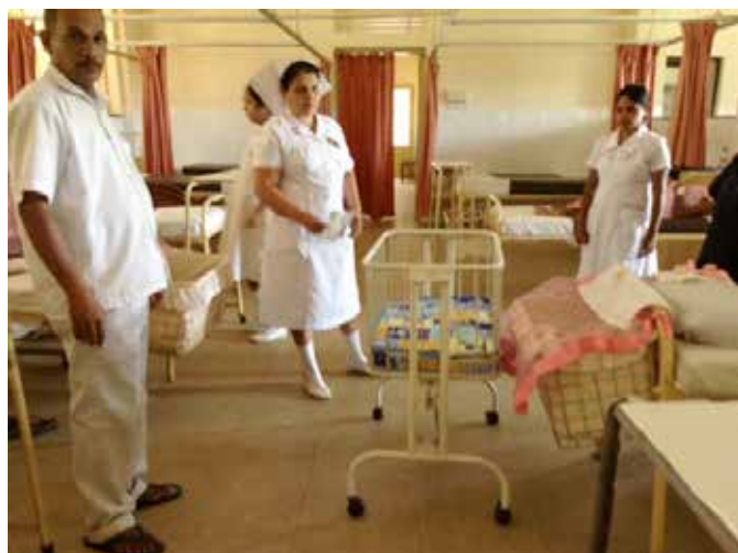
Un petit lit équipé