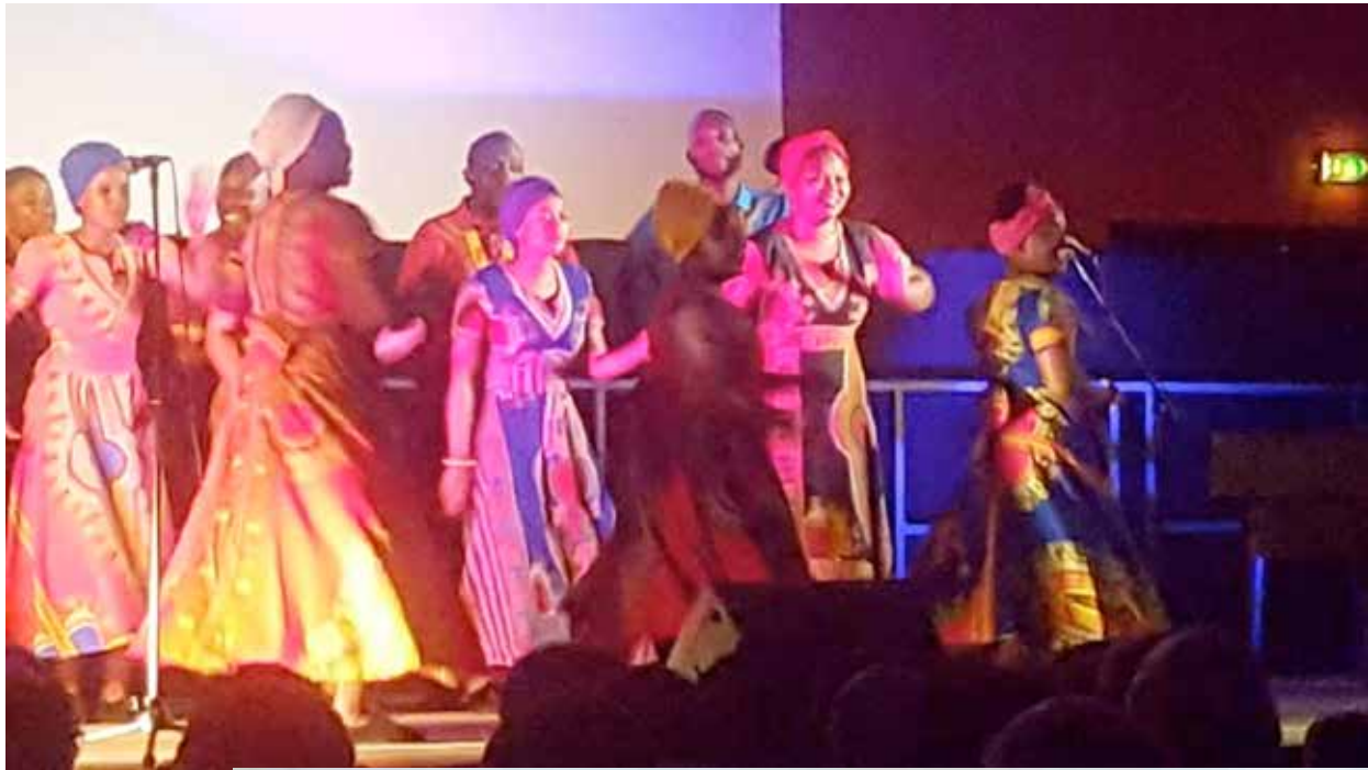
Soweto Choir et ses magnifiques costumes