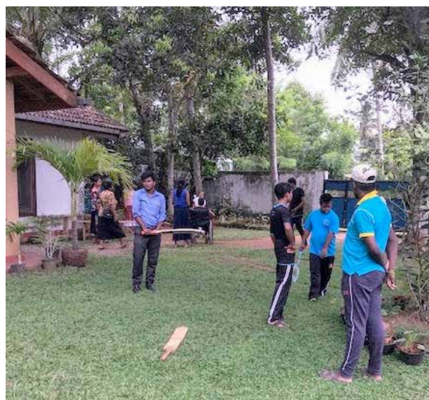
Les garçons au cricket