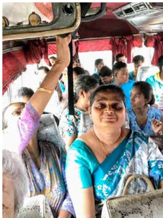
En partance avec SUMAGA pour Sithum Pathum