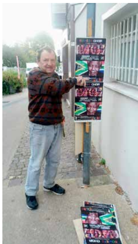
Collage frénétique !!!