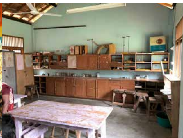
La salle de sciences