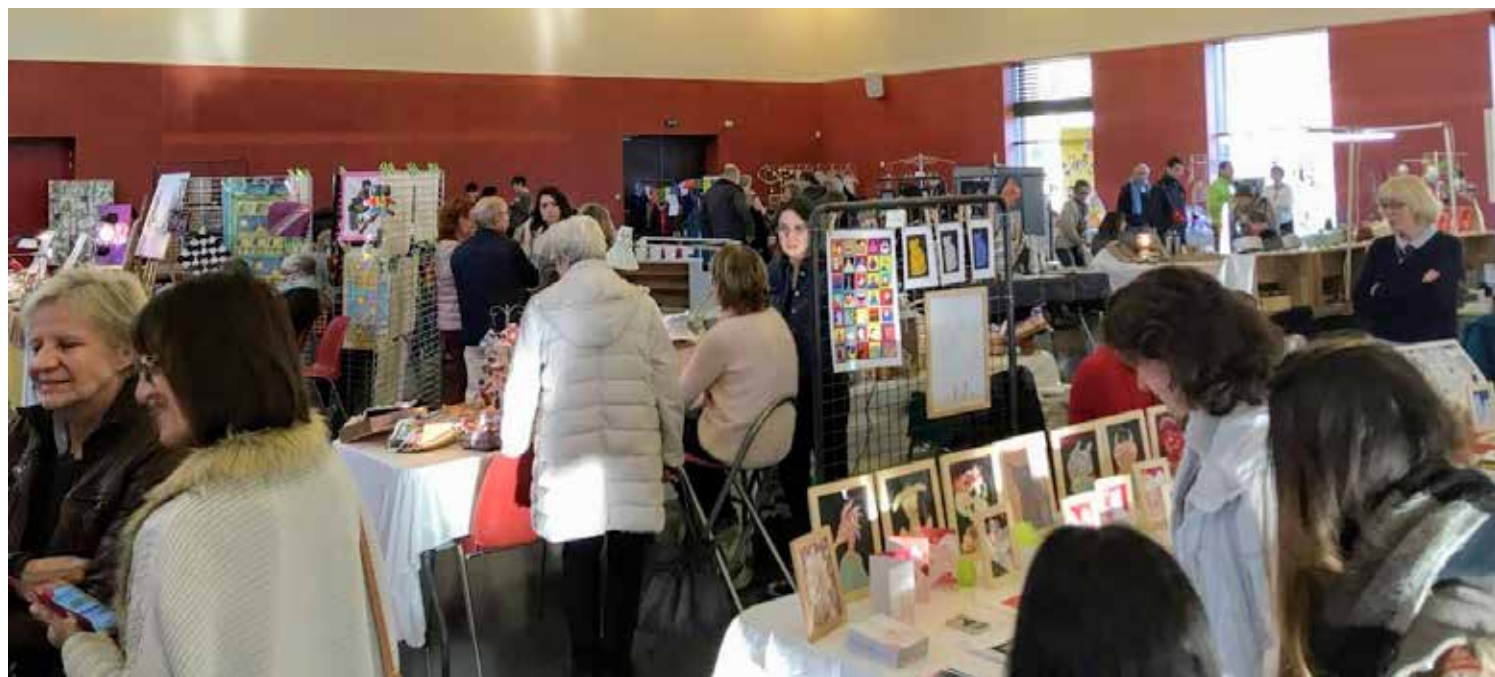
Les arts colorés : variété de styles