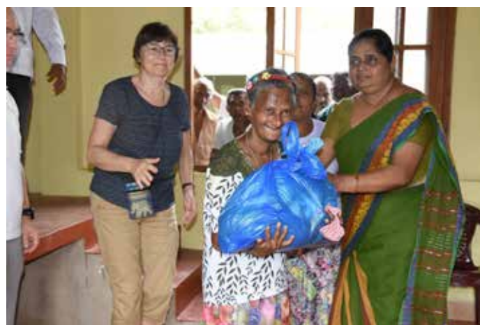
Distribution de colis alimentaires