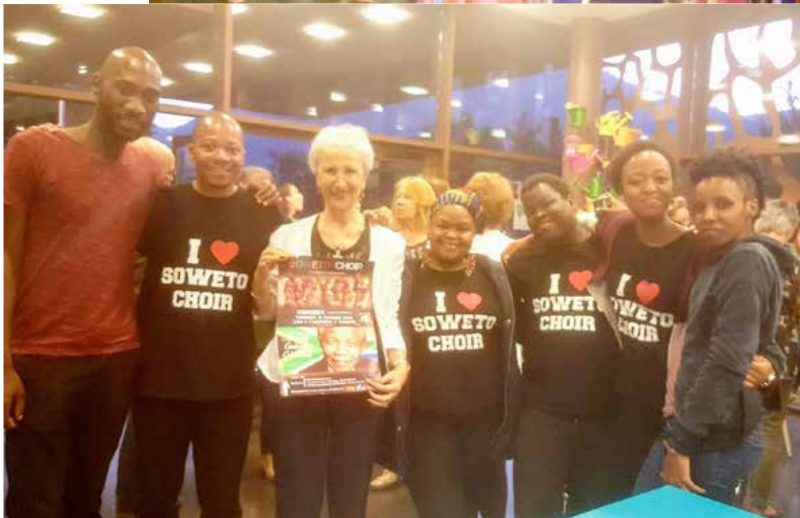
Tout le monde a signé l'affiche pour la Prési- dente