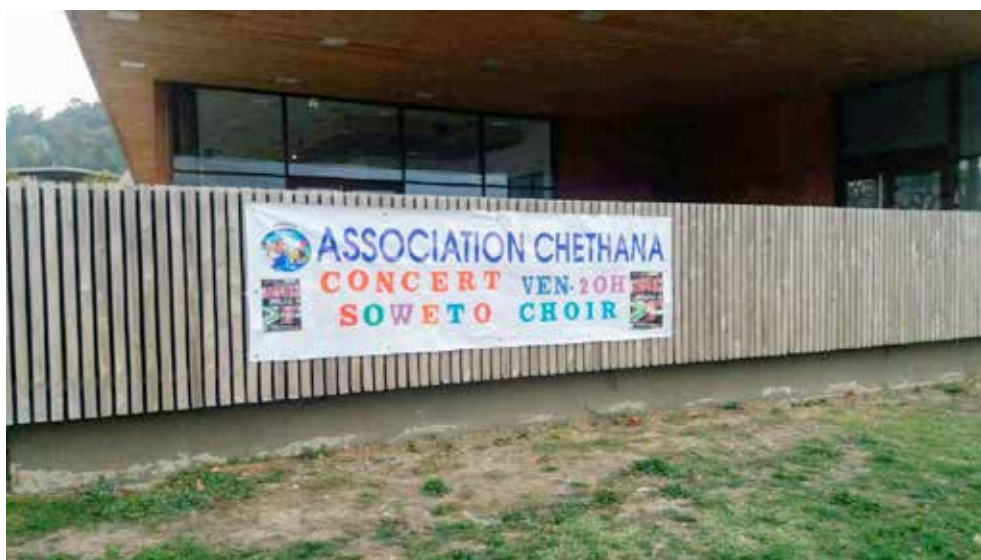
La publicité sur l'Arrosoir de Voreppe