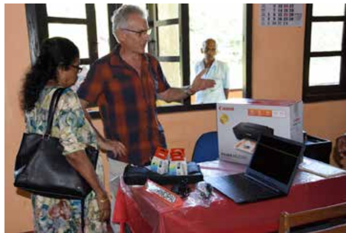
La remise de l'ordinateur à l'école Baddegama Hamiliya

La passion du président est la musique. Il avait apporté son piano électronique et avec un collègue ils ont animé la fête tout l'après-midi en chantant des chants de Noël ou autres. Les enfants et adultes handicapés ont chanté aussi, ainsi que nous les français (enfin, plutôt mes amis).