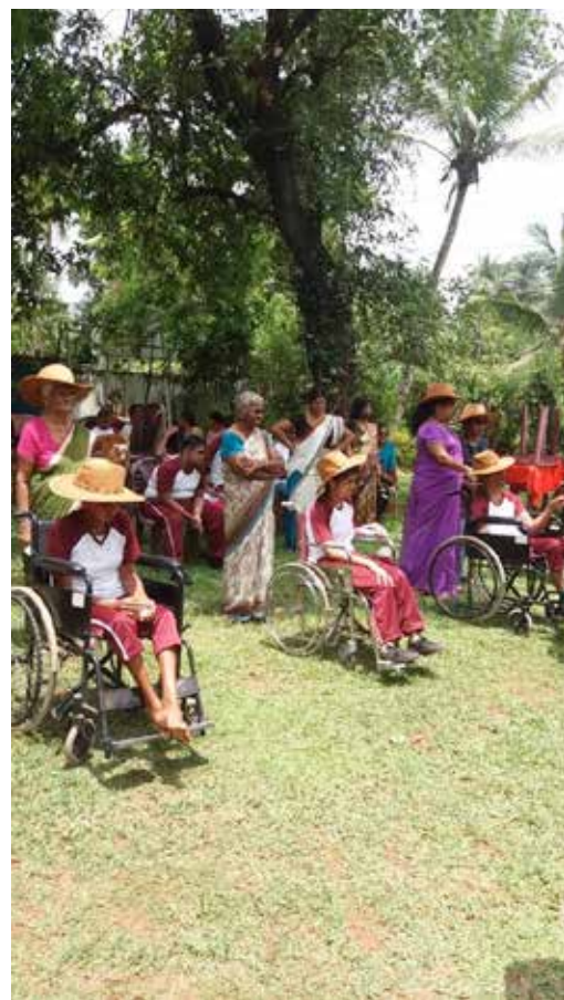
C'est la fête des enfants

Je pense que c'est la première fois qu'ils ont eu une fête comme celle-là . Le jardin est beau, très vert après la pluie. Nous avons dû louer tables et chaises. Nous avons invité des représentants du Département des Affaires sociales ! deux jeunes femmes officiers sont venues ainsi qu'un représentant du Conseil provincial. Il y avait aussi les parents et les institutrices.