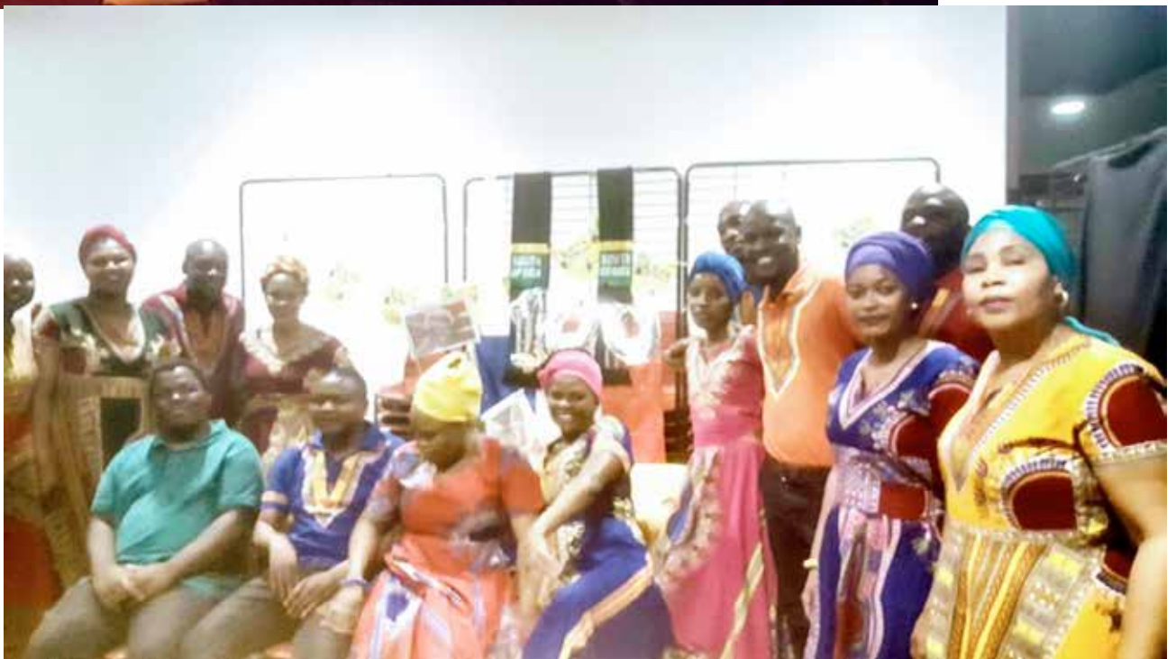
Soweto Choir : les 100 ans de Mandela