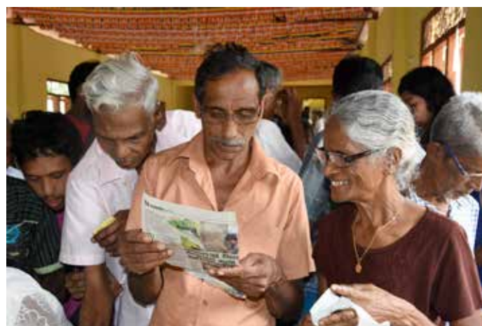
Distribution de lunettes