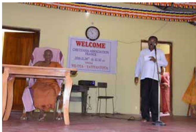
Accueil au village de YATIYANTOTA