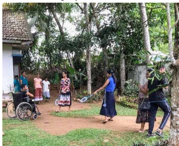
Les filles au badminton