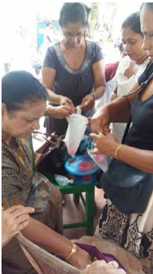
Les paquets se préparent

Nous avons obtenu des glaces yogourts, gâteaux et cadeaux pour les gagnants gratuits. Une de mes amies a donné 15.000 (80 €) pour la nourriture, le reste a été utilisé pour le lunch. Sumaga a pris en charge le transport des enfants (2 bus). Ça a été une journée fantastique pour les enfants. Ils ont été très contents. On a joué à la chaise musicale, dansé, fait le jeu du chapeau, collecté des fleurs et des feuilles dans le jardin et décoré un papillon. Ils étaient répartis en sept groupes. J'ai dépensé environ 45.000 Rps (250 €) pour le repas que j'ai préparé à la maison : poulet au curry, poisson pommes de terre, lentilles au curry, papadam, œufs, etc.