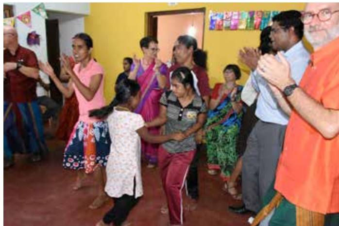
Noël à Gonapola

Que d'émotions ! Quelle qualité ! Aussi bien en danses, qu'en costumes, qu'en décors. Nous n'avons pas vu passer les trois heures de spectacle. Sithum Pathum