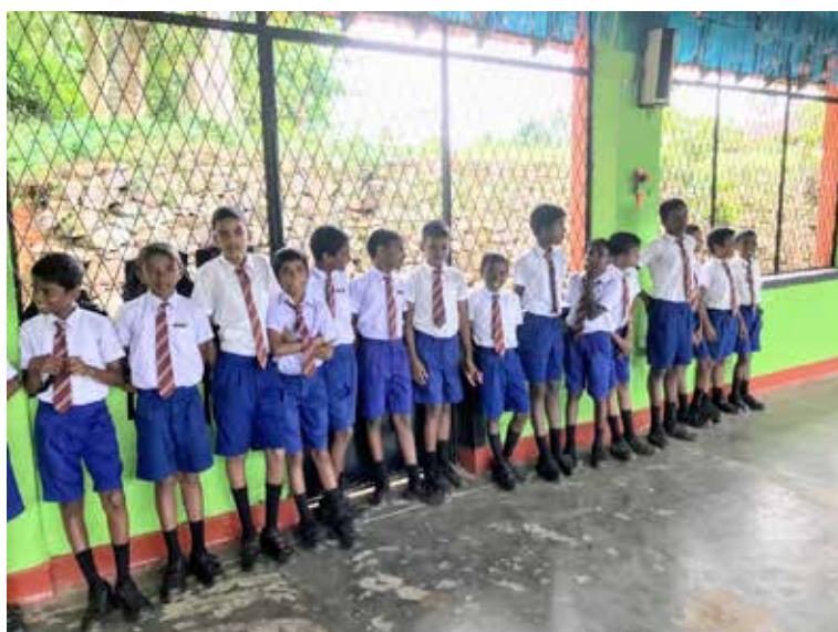
Enfants de la petite école