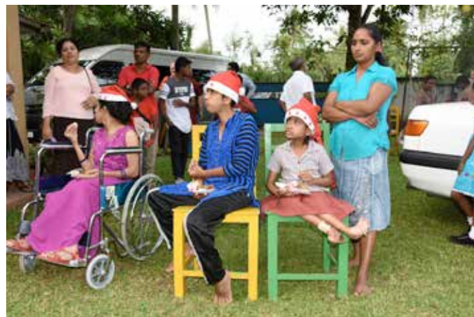
Noël à Gonapola