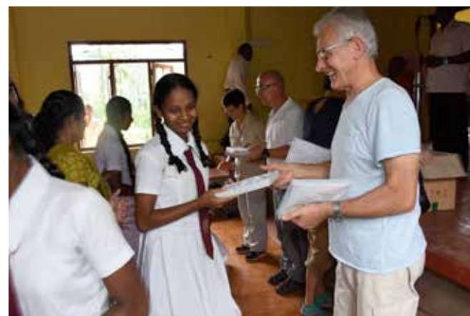
Distribution de matériel scolaire