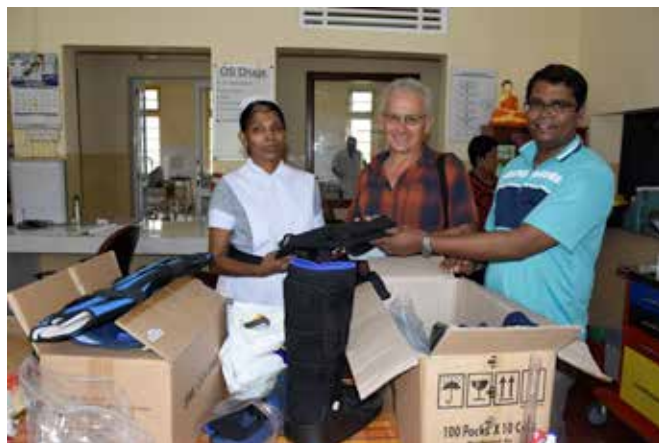
A l'hôpital de Colombo

Un des responsables nous a invité dans son hôtel en montagne. Notre chauffeur était inquiet. Il nous a fallu plus de